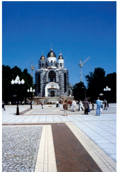
Königsberg, orthodoxe Kathedrale