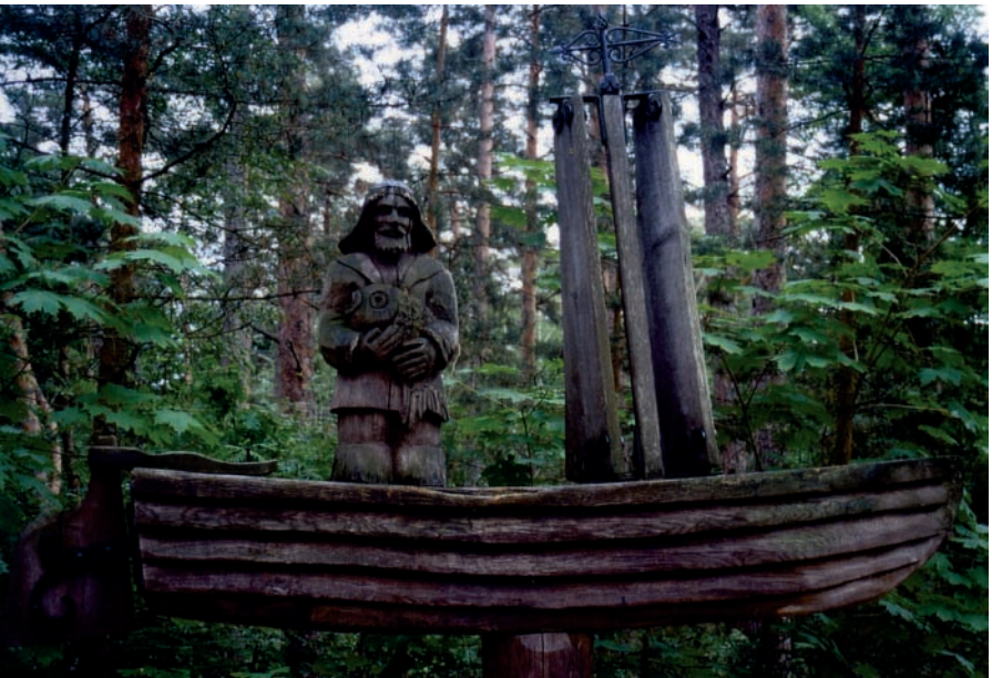
Schwarzort, Kuhrenkahn auf dem Hexenberg