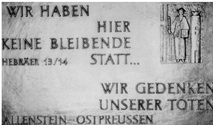
Gedenktafel in der Propsteikirche Gelsenkirchen