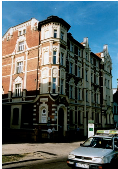
Alenstein, Haus Kopernikus