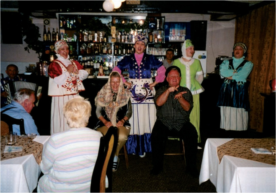
Folklore in Königsberg