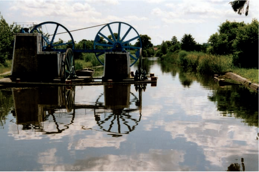
Räderwerk der geneigten Ebene