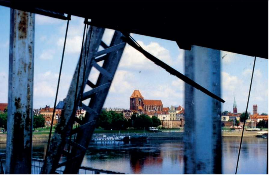
Blick auf Thorn von der Weichselbrücke