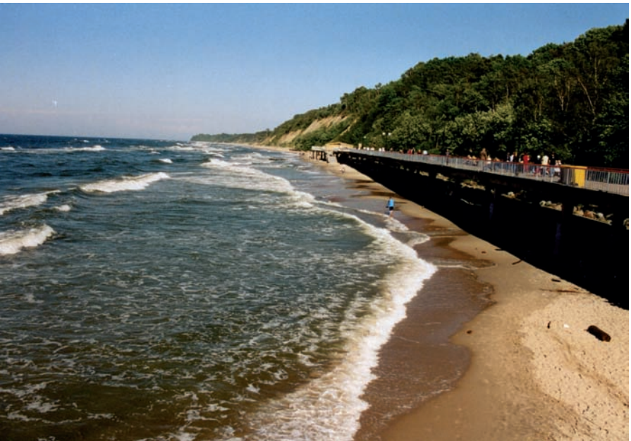
Samlandküste bei Rauschen