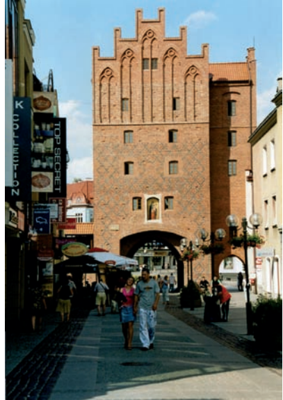
Allenstein, Hohes Tor