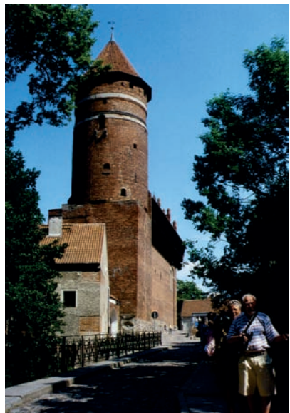
Allenstein, Brücke hinter dem Schloss