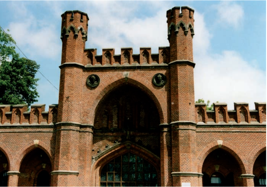
Königsberg, Roßgärtner Tor