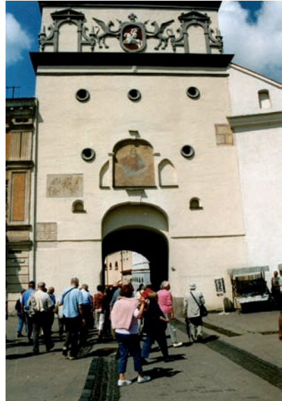
Vilnius, Tor der Morgenröte

Die Altstadt, "unser" Allenstein, nahm Gott sei Dank kaum Schaden. Man traf sich zum Beisammensein am Marktplatz vor Arkaden.