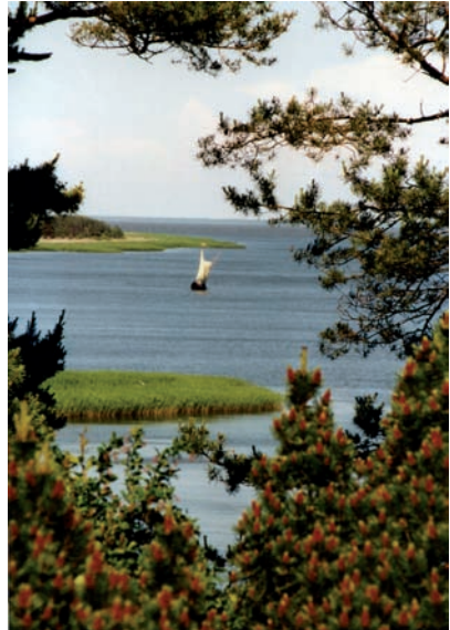
Nidden, Italienblick mit Kurenkahn

Die Führung endete sodann ganz offiziell am Hafen, wo etwas später 20 Mann am Kurenkahn sich trafen.