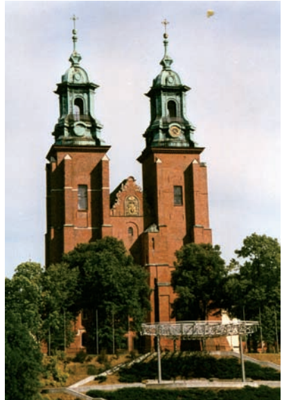
Dom zu Gnesen

Zeitgleich konnt' dieses Großturnier mit uns'rer Fahrt sich sonnen. Doch haben diese Reise wir am Ende auch gewonnen!