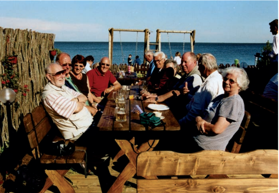
Nidden, Rast am Haß