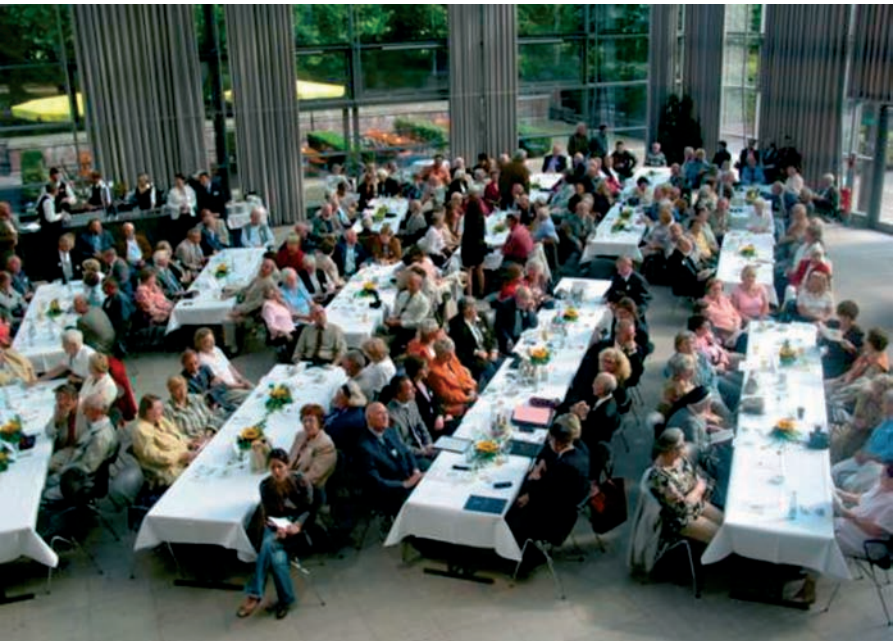
In der Glasshalle