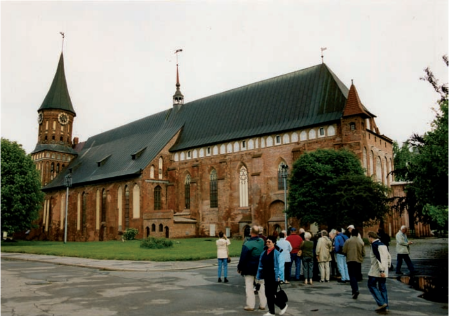
Der Königsberger Dom