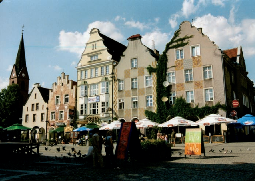
Der Marktplatz in Allenstein

Eine Bilderreise, aufgezeichnet und fotografiert von Ernst und Jutta Jahnke im Juni 2005