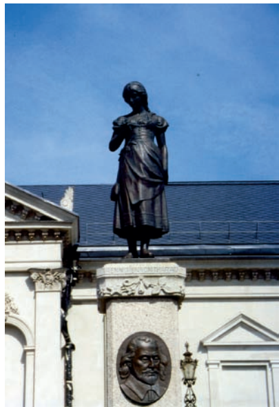
Memel, Ännchen von Tharau und Simon Dach