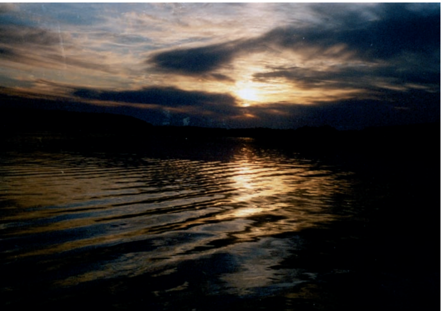
Allenstein, Sonneuntergang am Okullsee