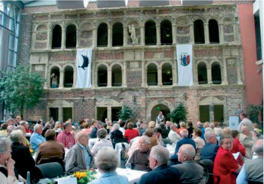
Ostpreußen und Allenstein