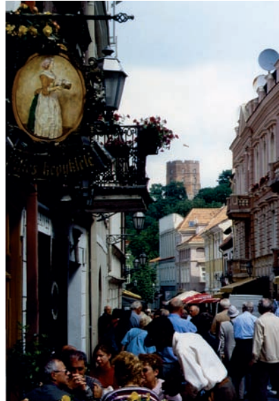
Vilnius, Straße zum Gediminias- turm

Der Glockenturm steht wie ein Pflock so ganz für sich alleine. Die Heiliggeistkirche, barock, ist eine ganze feine.