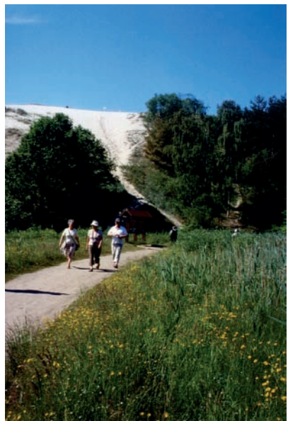
Nidden, Weg von der Hohen Düne