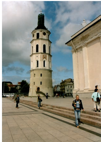
Vilnius, Glockenturm neben der Kathedrale