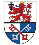
Landkreis Rotenburg (Wümme)